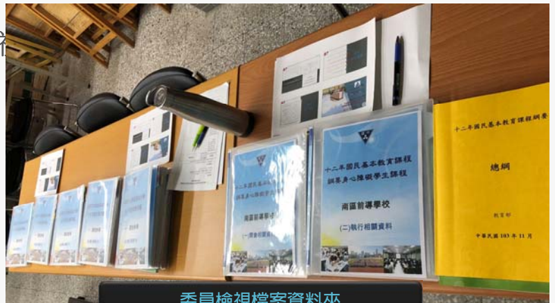
委員檢視檔案資料夾