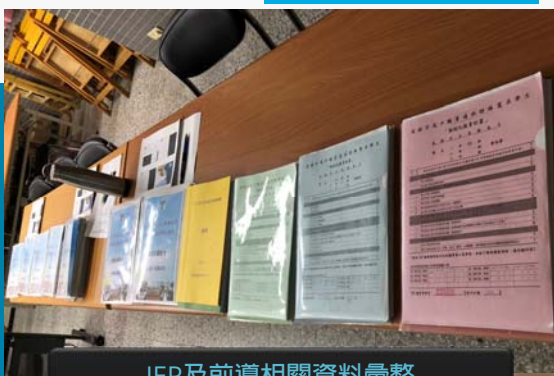
IEP及前導相關資料彙整