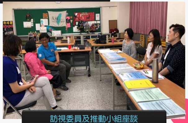
訪視委員及推動小組座談