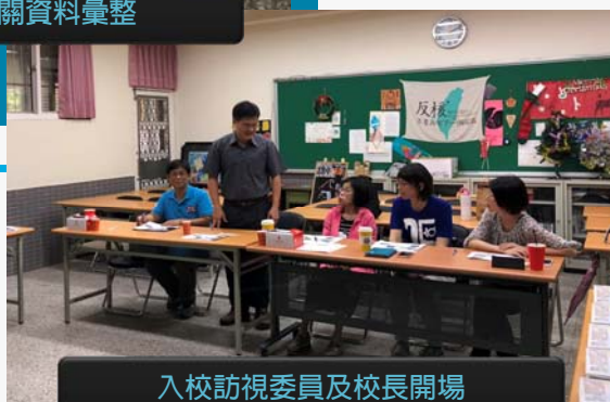
入校訪視委員及校長開場